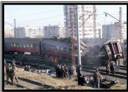
5 Декабря 2003 теракт Ессентуки

Следующий 2004 год стал пиком терроризма: в течение нескольких месяцев бандиты успели дважды подорвать московское метро, а также смертницы взорвали два пассажирских самолёта, атаковали Ингушетию и совершили несколько эффектных вылазок в самой Чечне. Эти теракты преследовали двойные цели: во-первых, запугать российский народ и лишить его воли к сопротивлению; во-вторых, разжечь пламя войны в соседних регионах. Именно ради этой цели Басаев и разработал теракт с захватом школы. Согласитесь, сложно придумать что-либо подлее, чем расправа с маленькими детьми.