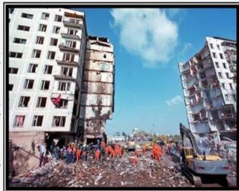
9 и 13 сентября 1999 года: взрывы жилых домов на улице Гурьянова и на Каширском шоссе.