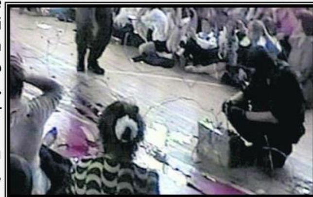
Террористы заминировали всю школу

Большинство заложников были согнаны в спортивный зал. Заставили всех сдать фото- и видеоаппаратуру, а также мобильные телефоны, которые разбивали. Снаружи школы были установлены камеры видеонаблюдения, а из «ГАЗ-66» были выгружены боеприпасы, тяжёлое вооружение и взрывчатка. Террористы забаррикадировали окна спортзала и входные двери, заминировали сам зал.