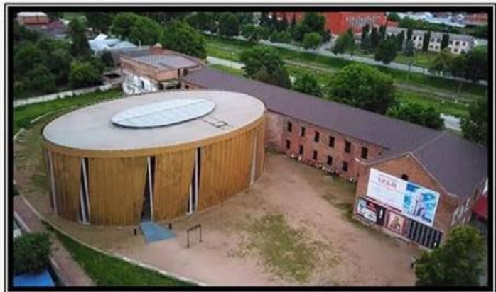
Золотой круглый саргофаг накрывает спортзал