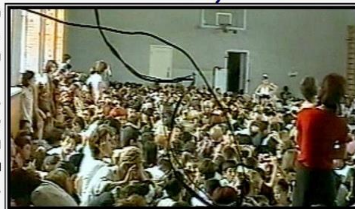
Заложники в школе в Беслане