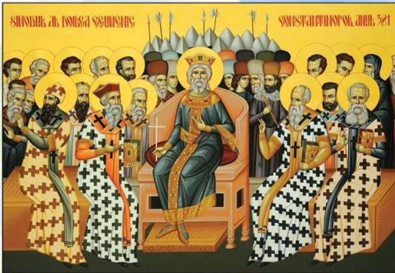
Икона II Вселенского собора

Историки говорят, что хотя праздник и был распространён повсеместно, официальное установление его произошло в конце IV века, когда на втором Вселенском соборе в Константинополе в 381 году было сформулировано учение о Троице.