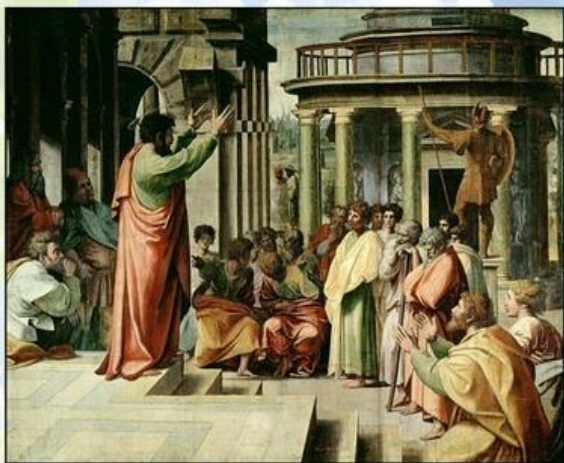
Проповедь апостола Павла

Апостолы поставляли первых верующих по духовном испытании во епископы и дьяконы. Со времён апостолов благодать Святого Духа непрерывно передаётся через Рукоположение от епископов епископам и поставляемым ими священнослужителям.