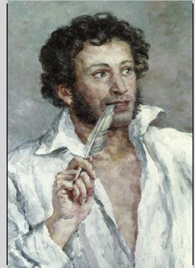
Фрагмент картины П. П. Кончаловского «Пушкин, сочиняющий стихи»

Великим быть желаю, Люблю России честь, Я много обещаю — Исполню ли? Бог весть! А. С. Пушкин