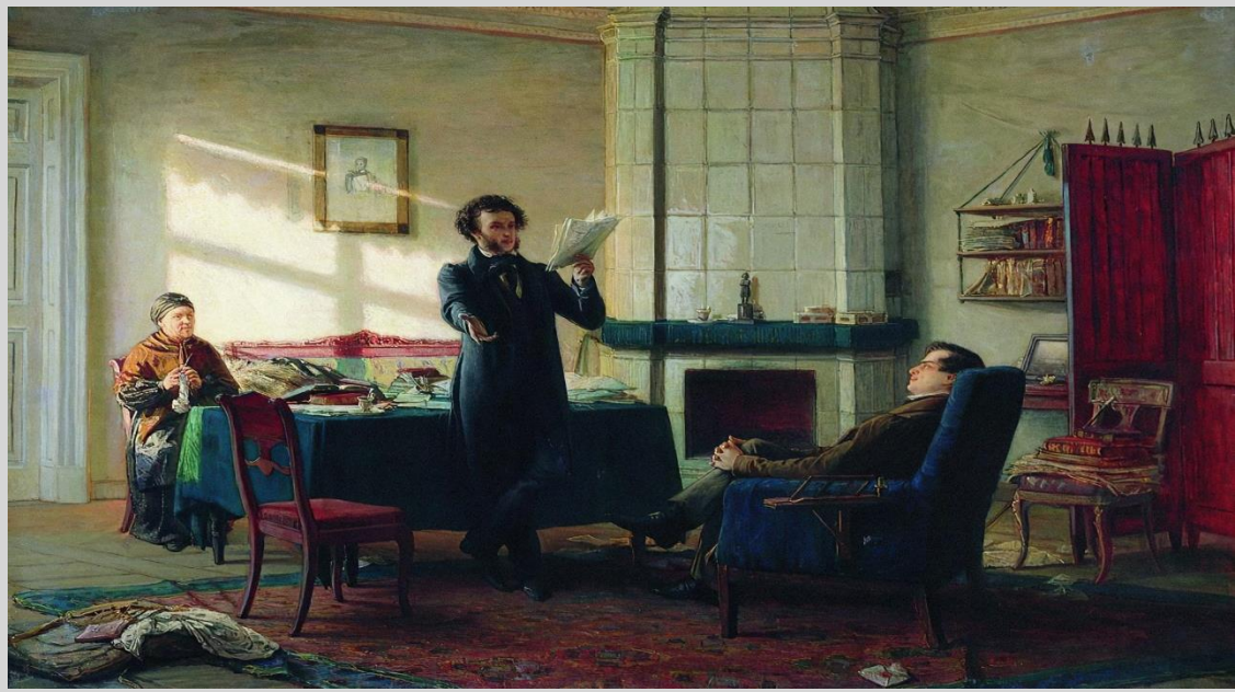
Пушкин в селе Михайловском (Пущин у Пушкина). Художник Н. Н. Ге. 1875 Г.

В 1824 году А. С. Пушкин был отправлен в ссылку в родительское имение Михайловское. Туда он отправился сразу после южной ссылки. Его обвинили в вольнодумии и склонности к атеизму, о котором он высказывался в письме к своему другу. Здесь поэт проводил время с родителями, а после их отъезда жил с няней. В селе он продолжает работу над «Евгением Онегиным», создает «Бориса Годунова», пишет стихотворения. Его часто навещали друзья, которые рассказывали ему все новости из столицы, привозили ему литературу. Именно сюда его друг Иван Пущин привез Пушкину книгу Грибоедова «Горе от ума», от которой тот оказался в полном восторге.