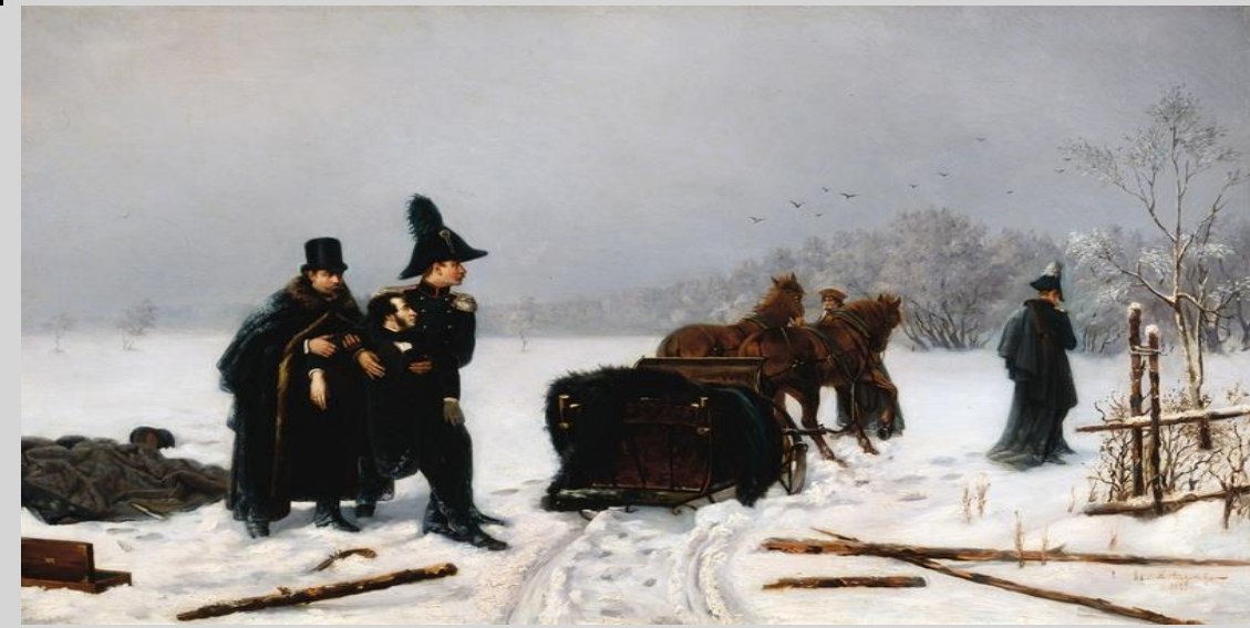
Дуэль Пушкина с Дантесом. Художник А. Наумов 1884 г.