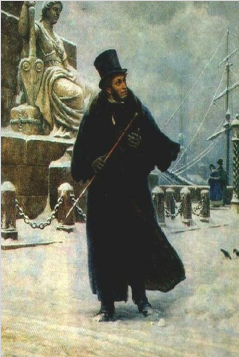
Б. В. Щербаков «Пушкин в Петербурге» (1949) Холст, масло.

Исследователи творчества А. С. Пушкина во всей литературной деятельности писателя и поэта выделяют несколько периодов, одним из которых является Петербургский период, охватывающий 1817-1820 гг.