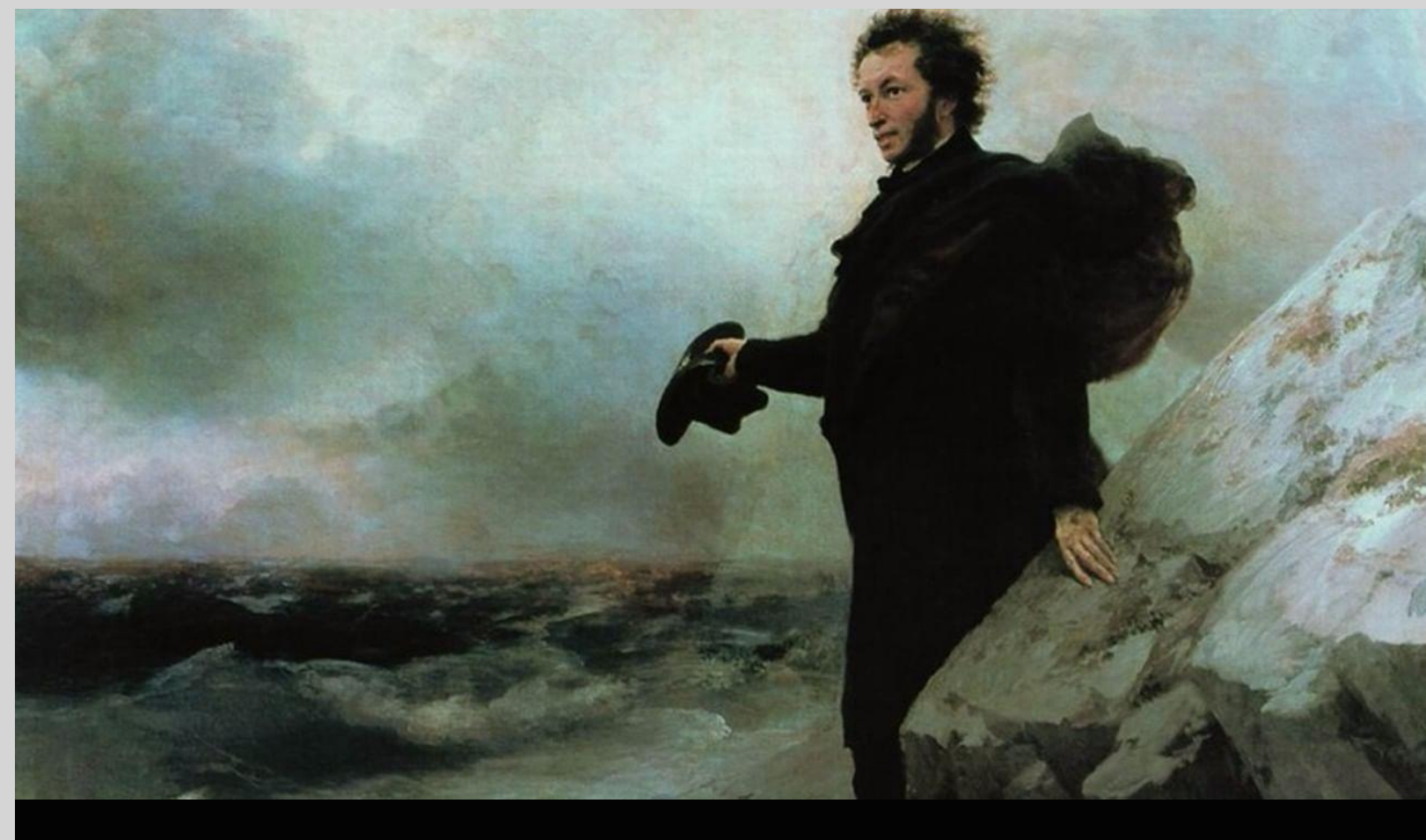
Айвазовский И. К. «Пушкин прощается с морем» (1897 г.)

С 1820-го по 1824-й год, Пушкин пребывал в южной ссылке, за написание едких эпиграмм на власть, которые сам Александр I назвал «возмутительными стихами». Благодаря помощи Н. М. Карамзина, В. А. Жуковского и П. Я. Чаадаева писатель получает от царя снисхождение, и вместо ссылки в Сибирь А. С. Пушкин уезжает в южные губернии. Он провёл эти годы на Кавказе, в Крыму, Кишинёве и Одессе.