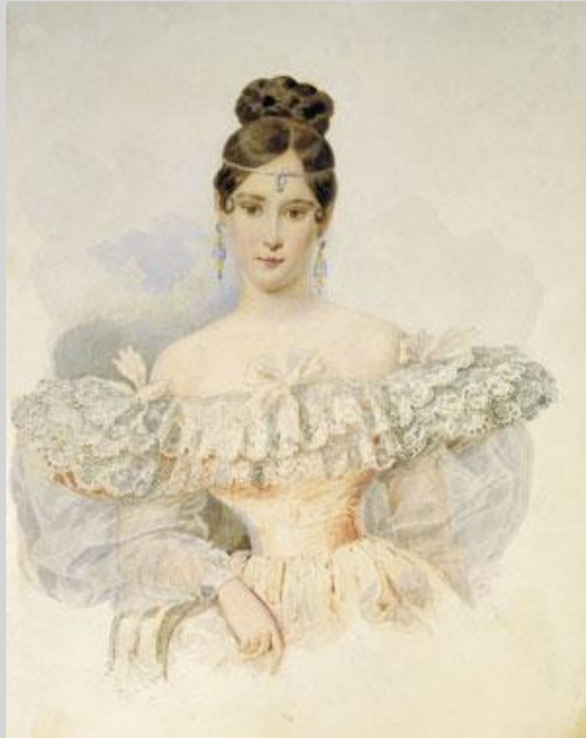
А. Брюллов. Н. Н. Пушкина. 1831–1832 гг.

В начале 1834 г. в Петербурге появился француз барон Дантес. Он влюбился в жену Пушкина и стал за ней ухаживать. 8 февраля 1837 года, в 5-м часу вечера, на Черной речке в Петербурге состоялась роковая дуэль, на которой Пушкин был смертельно ранен. Прожив 2 дня в страшных мучениях, Пушкин скончался 10 февраля 1837 года. «Солнце русской поэзии закатилось», – написал В. Жуковский.